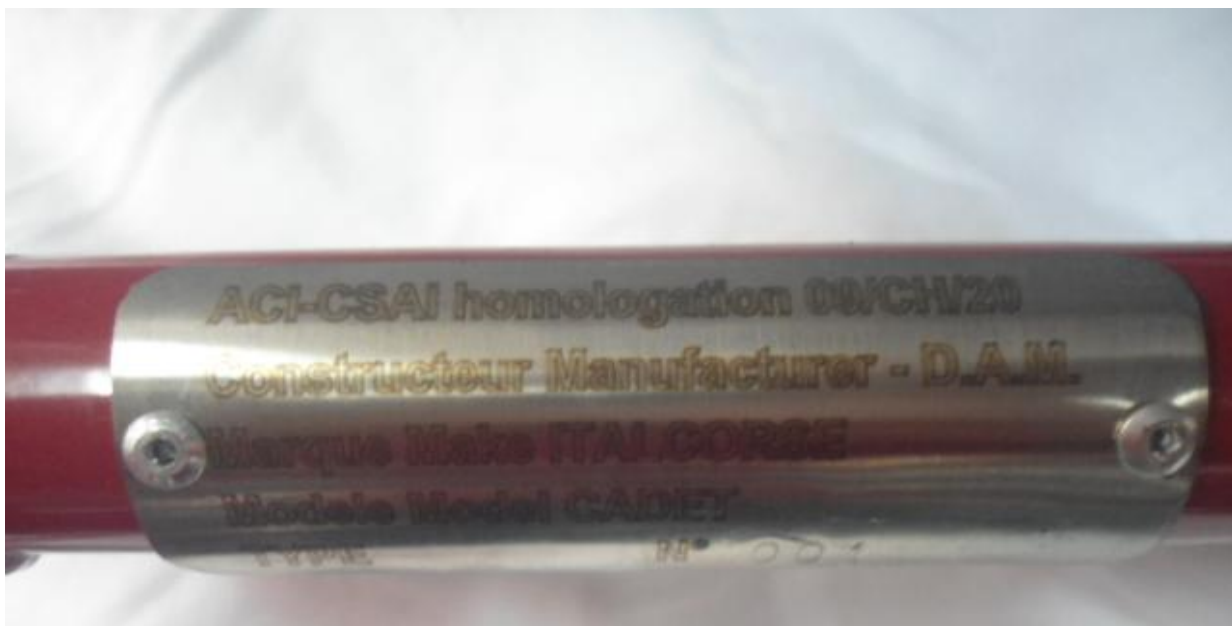
Foto della placchetta che evidenzia il n°di omologa , il nome del modello e il n°del telaio, la stessa dovrà essere fissata nella traversa posteriore B5 verso il centro del tubo stesso.